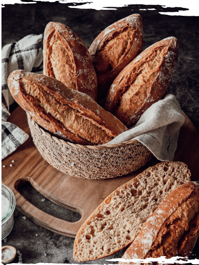
HB 857785 Bauernspitz 80 x 100 g