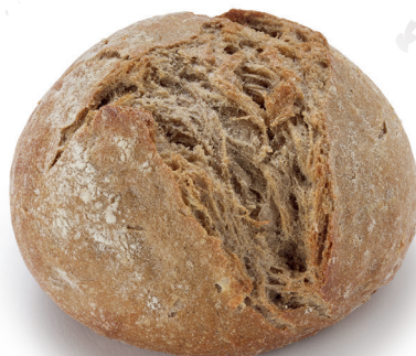
HB 8103899 XL Kartoffelbrötchen, dunkel 60 x 115 g