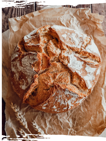
HB 857784 Krustenmeister 10 x 530 g