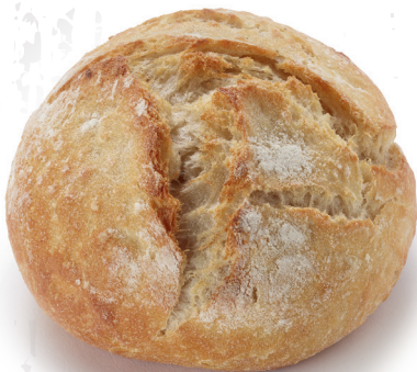
HB 8103900 XL Kartoffelbrötchen, hell 60 x 115 g