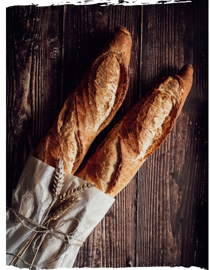
HB 857781 Baguette Rustique 20 x 330 g